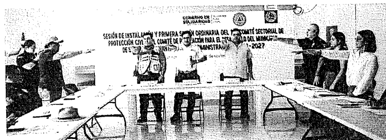
Las mesas de diálogo iniciarán mañana en el fraccionamiento La Guadalupeana.